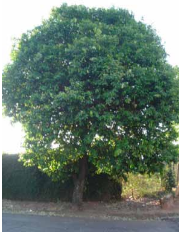
Figura 1. Oiti ( Licania tomentosa ).

A Avenida Rio Branco possui 275 imóveis, dos quais 115 não possuíam qualquer tipo de exemplar, ou seja, existe 42% de imóveis sem árvore (Figura 2), nos imóveis restantes haviam 256 exemplares arbóreos de 16 espécies diferentes, como mostra a Tabela 1, onde é possível observar que a espécie predominante é a oiti ( Licania tomentosa ) (Figura 1) com aproximadamente 57% de todas os exemplares existentes nesta via. Na Capitão José Antônio de Oliveira foram encontrados 114 imóveis, dos quais 55 não possuíam árvores, o que implica em 48% dos lotes sem exemplares arbóreos (Figura 2), no restante dos imóveis foram encontrados 88 exemplares de 10 espécies diferentes (Tabela 2), onde se predominava a oiti, com aproximadamente 73% das árvores existentes no local.