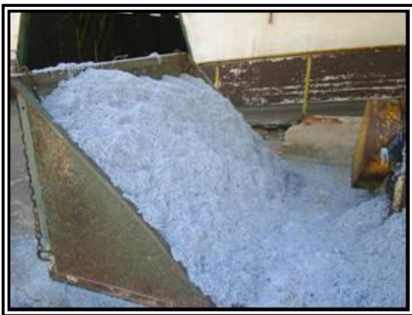
Figura 3: Resíduo "aparas ou pó de couro Wet Blue ", obtido pela ação da máquina Rebaixadeira.