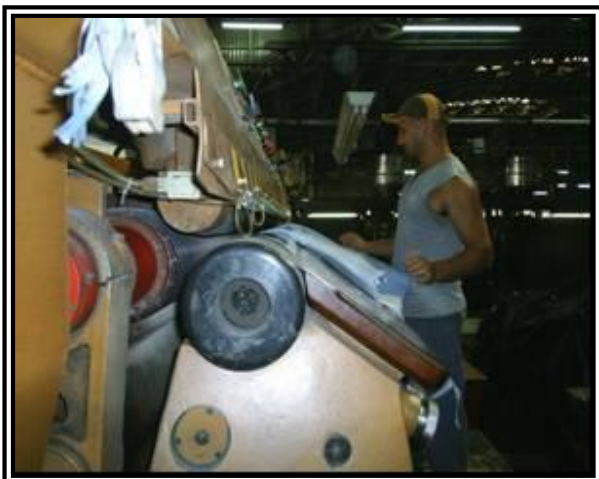
Figura 1: Máquina Rebaixadeira.