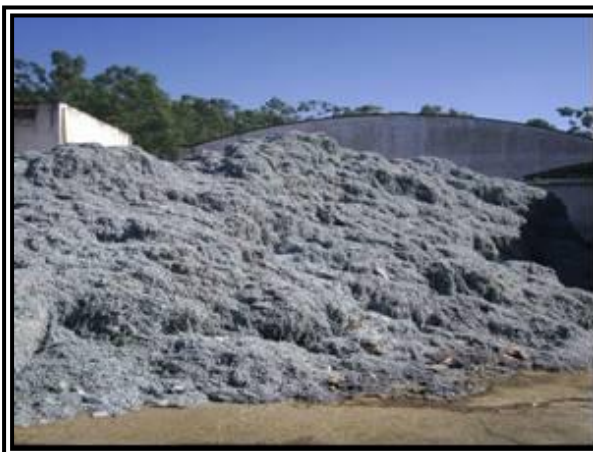
Figura 4: Resíduo aguardando o transporte para aterros industriais.

Conforme as normas da ABNT (2004), para classificação de resíduos, as aparas de couro Wet Blue devem ser destinadas a aterros industriais (Figura 5).