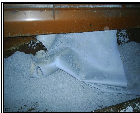
Figura 2: Couro Wet Blue , submetido à ação da máquina Rebaixadeira.